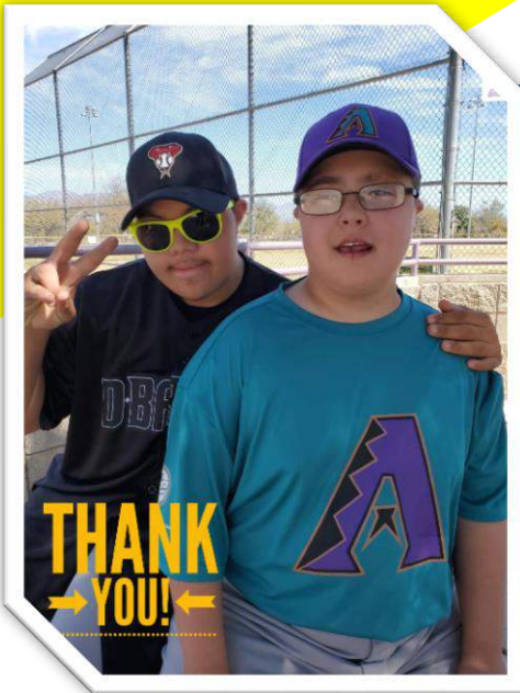
Orgullosamente presentando a los miembros de la comunidad de SANDS